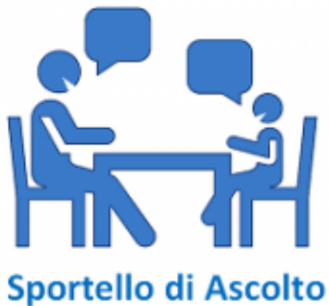
Sportello di Ascolto